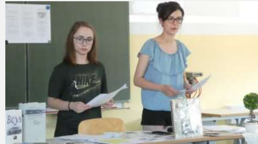
Jugendliche des Gymnasiums Herzberg bei der Präsentation von Schicksalswegen ehemaliger KZ-Häftlinge